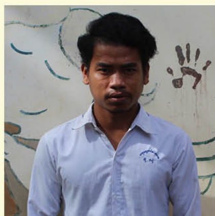
Sou Daro (開心家園) 高棉文學