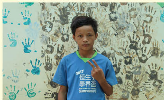
Chab Ya 努力學習，考獲全班第一名。