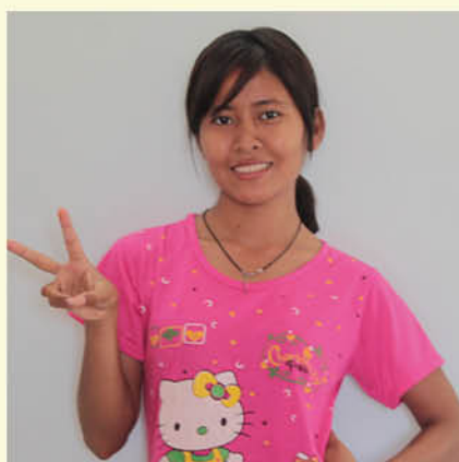
Chem Cham Reoun (開心家園) 旅遊業