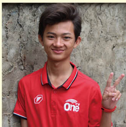
Yun Lim Seang (彩虹橋) 資訊科技